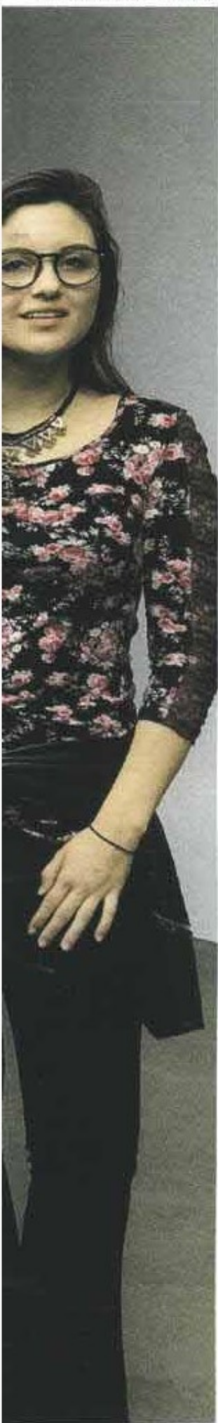
Profissionais da F.biz